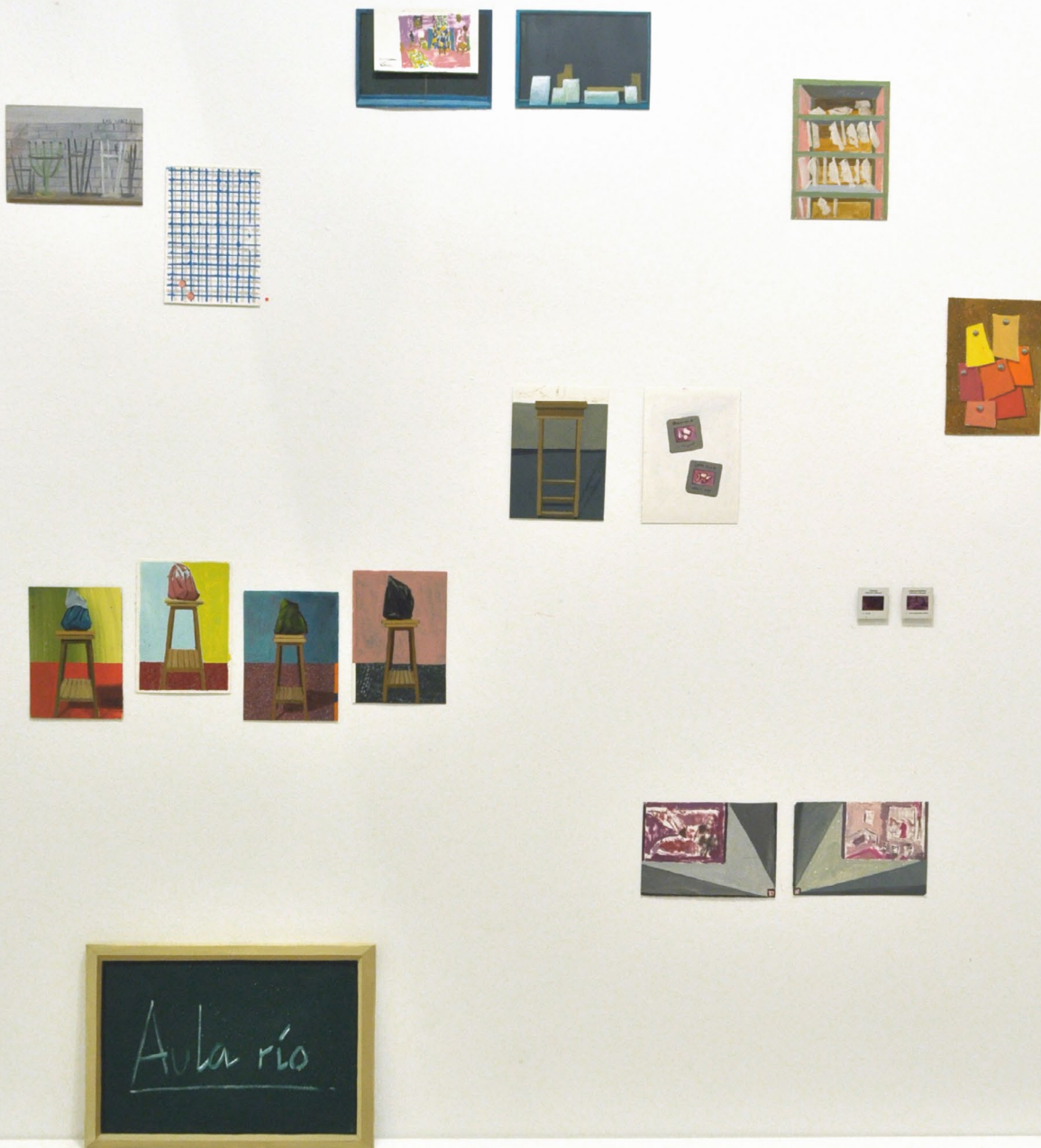
Composición de bocetos 2023 Óleo sobre cartón 15,5 x 21 cm cada uno