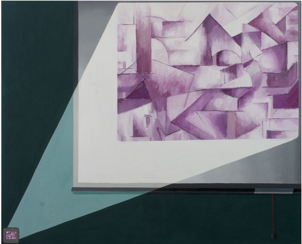
Diapo II 2023 Óleo sobre lienzo 81 x 100 cm