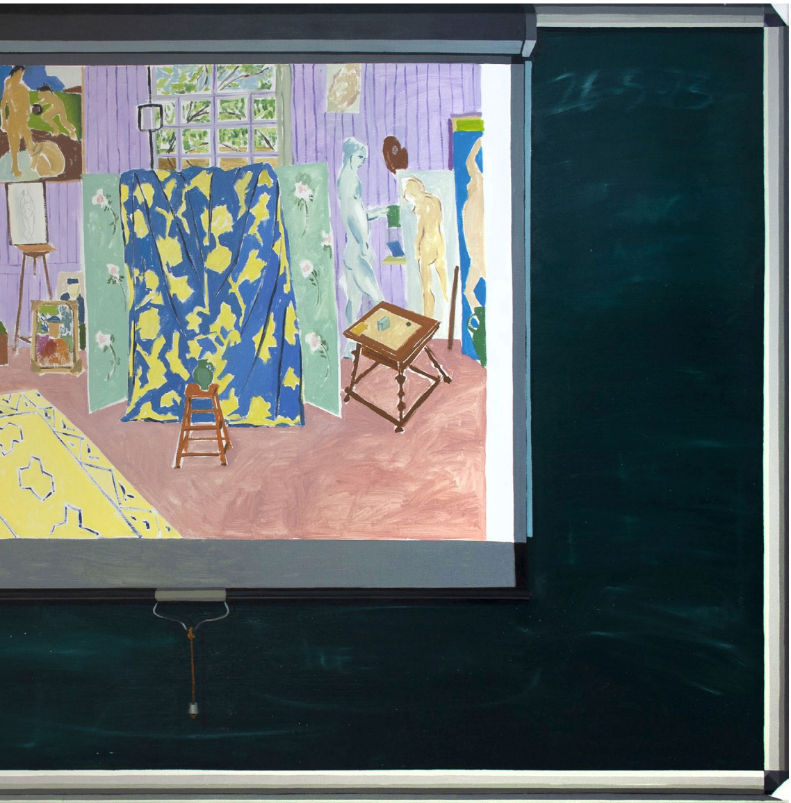
La pizarra 2023 Óleo sobre lienzo 130 x 195 cm