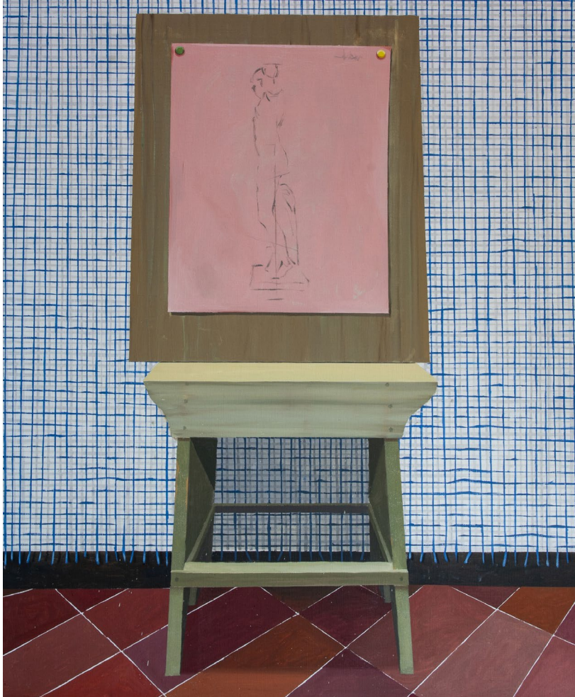
Bien mueble 2023 Óleo sobre lienzo 100 x 81 cm