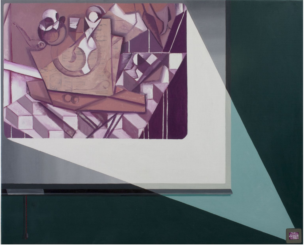
Diapo I 2023 Óleo sobre lienzo 81 x 100 cm