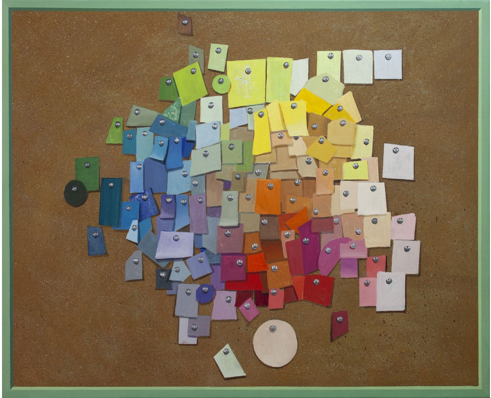
Prueba de color 2023 Óleo sobre lienzo 81 x 100 cm