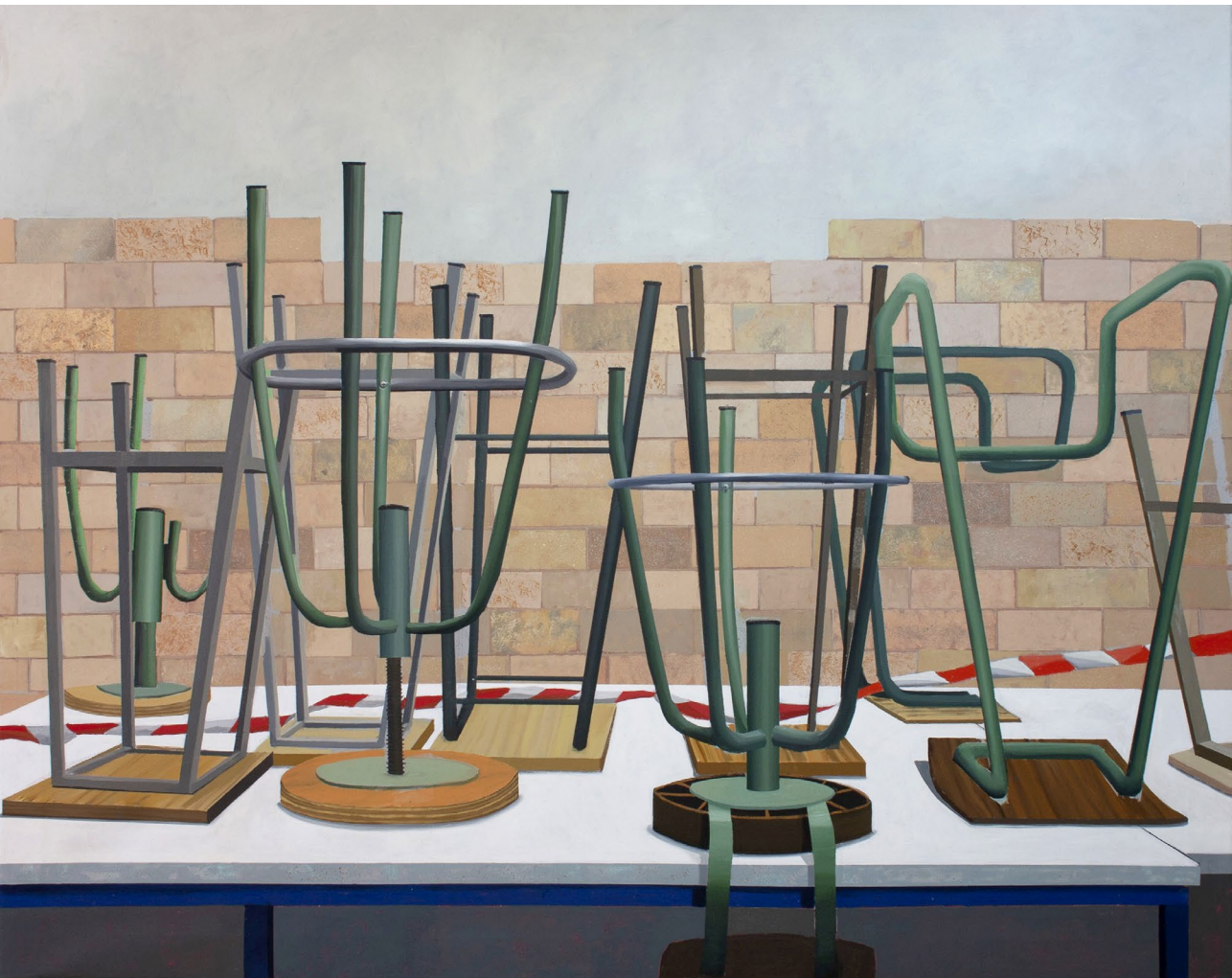
Las lanzas 2023 Óleo sobre lienzo 130 x 162 cm