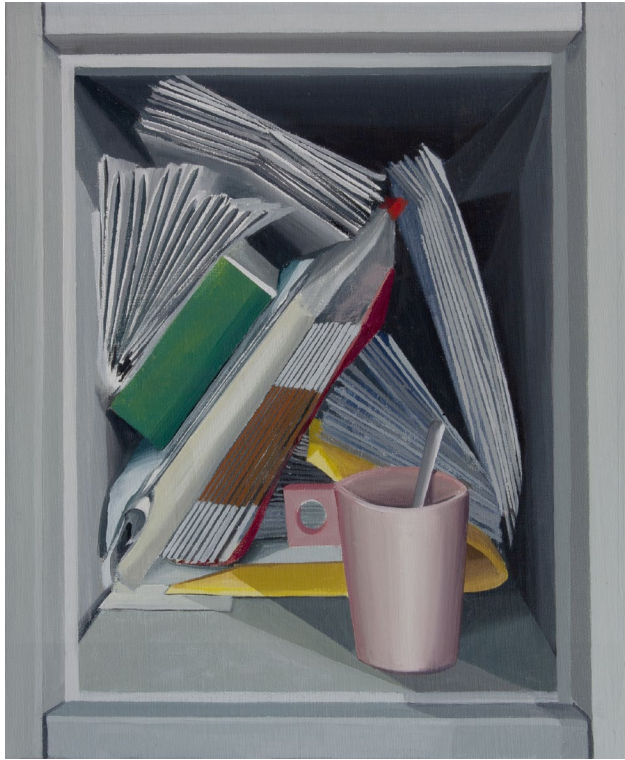
Taquilla 2023 Óleo sobre lienzo 46 x 38 cm