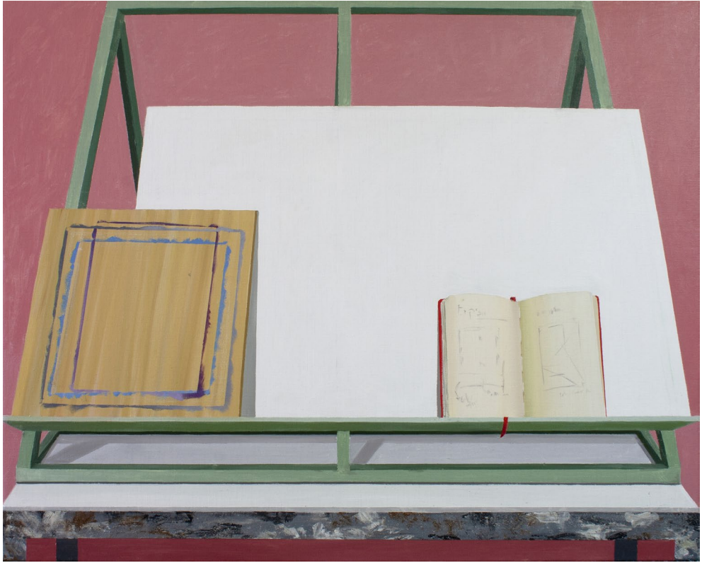
El caballete de la 23 2023 Óleo sobre lienzo 81 x 100 cm