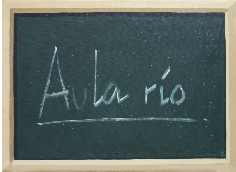
Aula río 2023 Óleo sobre lienzo 33 x 46 cm