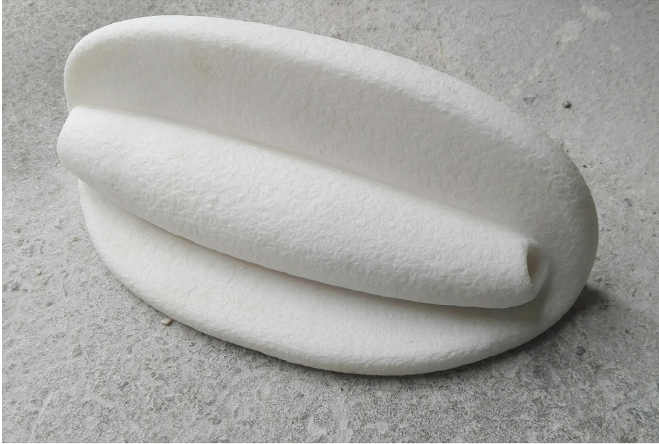
Sin título 2003 Mármol portugués. 46 x 22 x 15 cm