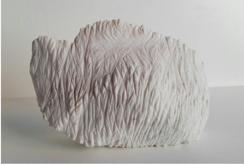
Sin título 2011 Mármol portugués. 20 x 20 x 10 cm