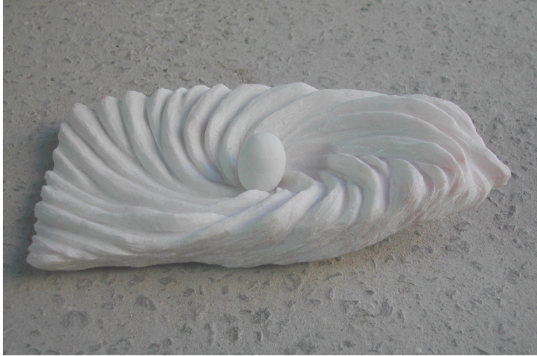
Sin título 2009 Mármol portugués. 27 x 13 x 7 cm