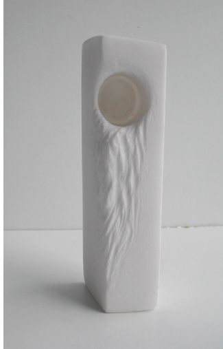
Sin título 2008 Mármol portugués 16 x 5 x 5cm