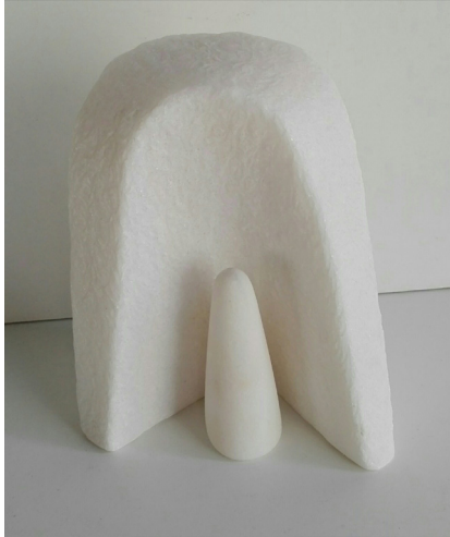
Sin título 2016 Mármol portugués. 15 x 13 x 8 cm