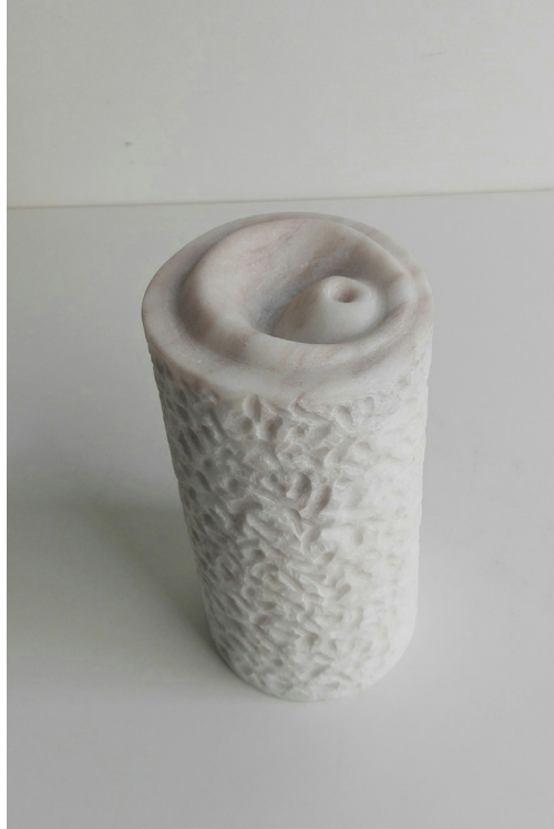
Sin título 2007 Mármol portugués. 10 x 10 x 20 cm