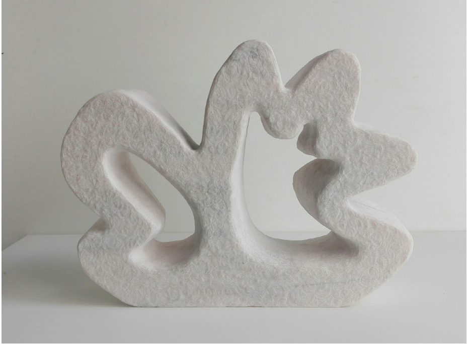
Sin título 2016 Mármol portugués. 40 x 31 x 10 cm