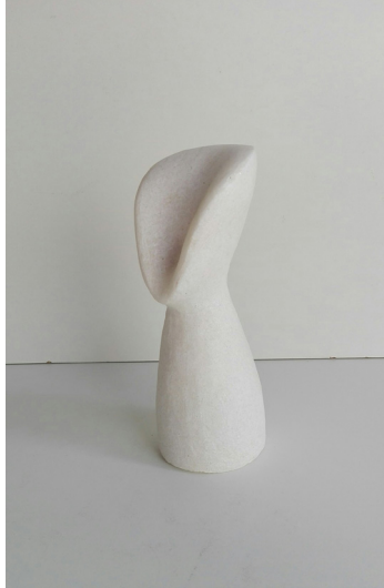
Sin título Mármol portugués. 17 x 7 x 7 cm