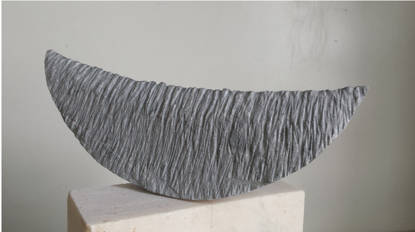
Sin título 2015 Mármol portugués. 12 x 29,5 x 4 cm