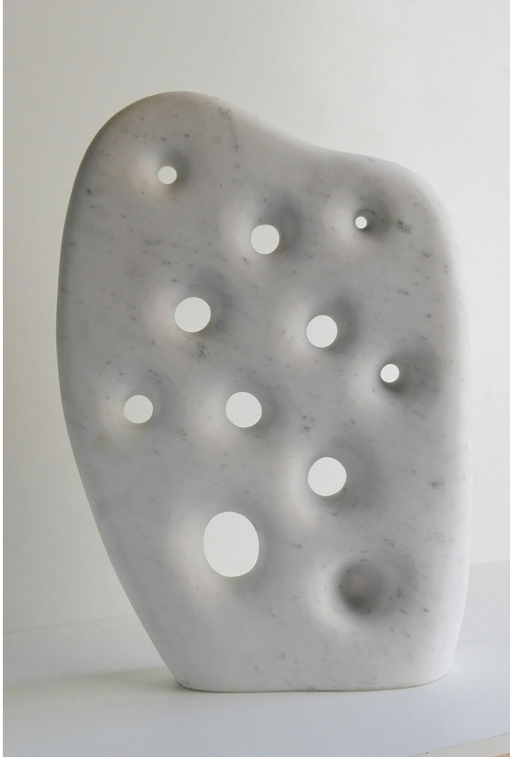
Sin título 2006 Mármol portugués. 60 x 43 x 10 cm