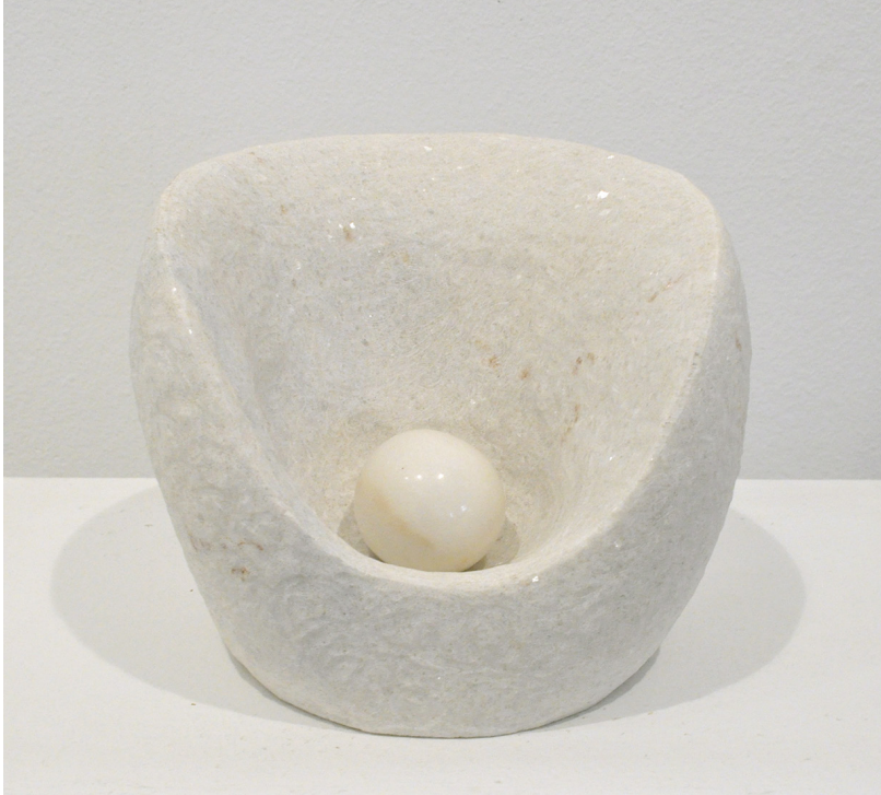
Sin título 2014 Mármol portugués. 21 x 18 x 16 cm