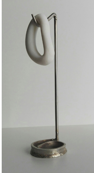
Sin título Mármol portugués y acero 25 x 6,5 x 6,5 cm