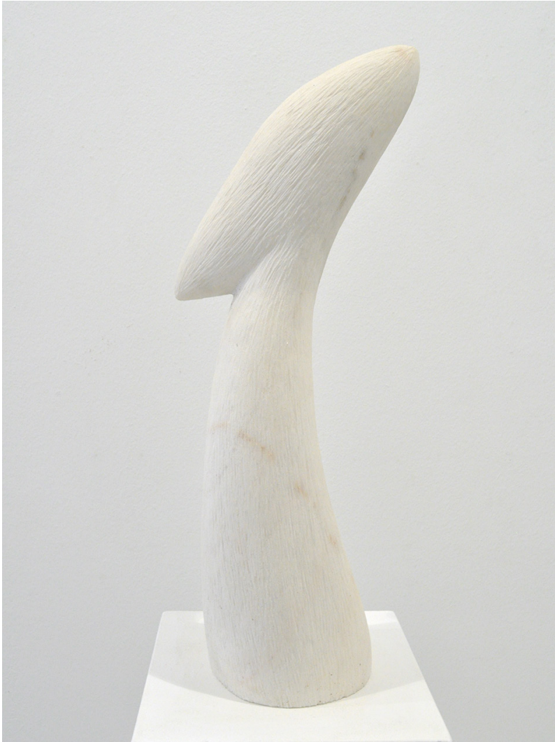
Sin título 2001 Mármol portugués. 69 x 26 x 19cm